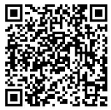
その他リフォーム施工例

一部枯れた生垣を伐採して 化粧ブロックを1段追加し、 縦格子のフェンスを取り付けました。